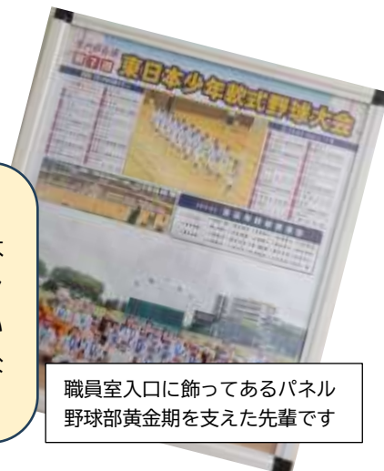
職員室入口に飾ってあるパネル 野球部黄金期を支えた先輩です