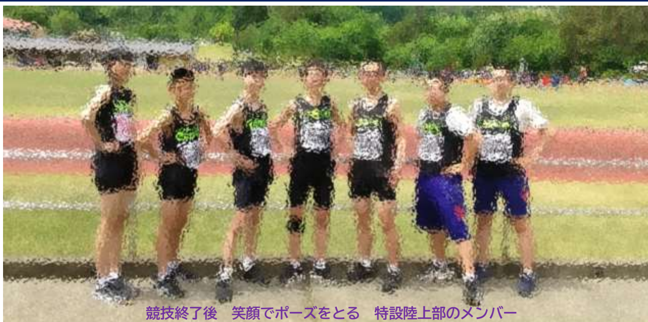
競技終了後 笑顔でポーズをとる 特設陸上部のメンバー

5月26日(日)、一戸町総合公園陸上競技場において、二戸地区中学校陸上大会が行われました。きれいな青空が広がるさわやかな天候の中、本校特設陸上部からも7人が出場しました。この日に照準を合わせてトレーニングを積んできた選手たち。朝一番からいい顔をしていました。絶好調です! テント内の雰囲気も良く、1か月の練習期間を通して、チームとしてのまとめりが強くなっていると感じました。結果は、自己ベストを更新した選手が多く、収穫の多い大会となりました。県通信陸上大会は、北上総合運動公園陸上競技場で行われます【6/29(土)・30(日)】。これからもFight! 特設陸上部!!