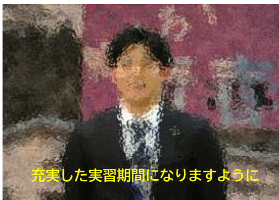
充実した実習期間になりますように

先週から、教育実習生が来ています。平成29年度に本校を卒業した先輩です。紹介式では、実習生からのさわやかなあいさつと力強い意気込みに、歓迎の大きな拍手が送られました。