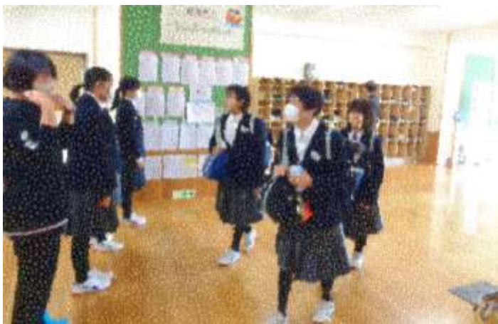
あいさつは 楽しい会話のきっかけにも なっています

生活学習委員会は、毎月第2・4週の月曜日から金曜日までを活動日とし、今年度の運動をスタートさせました。設定時間は、多くの生徒が登校する7時55分～8時05分の10分間です。